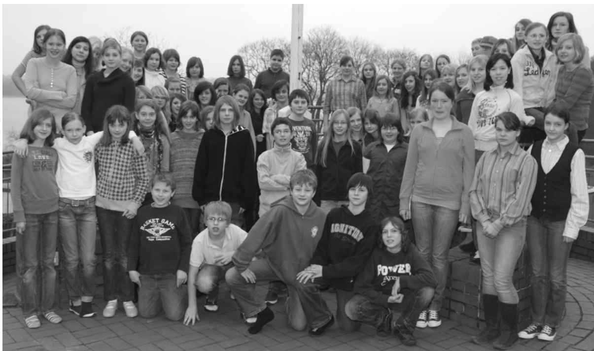
Die Musicalgruppe im März 2009