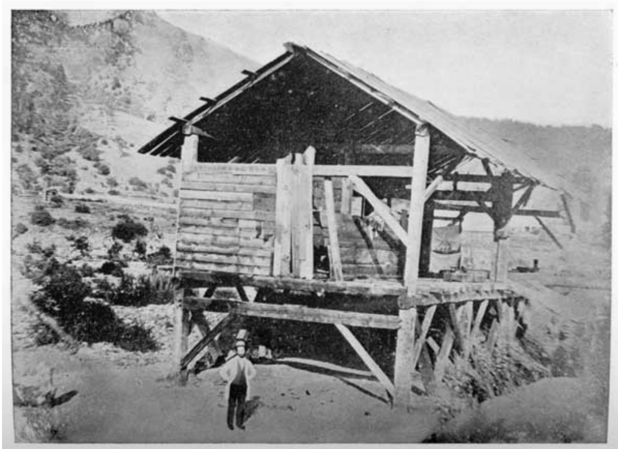
'Sutter's Mill' - Die kleine Sägemühle war Ausgangspunkt für den Goldrausch von 1848